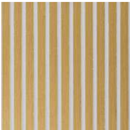
10040374279 Nature oiled Oak / Beige