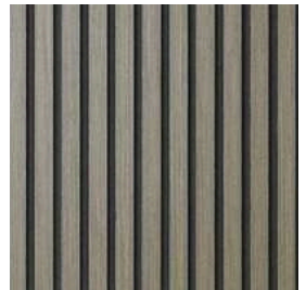
10040374287 Silver Oak / Sesam