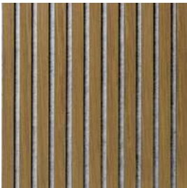
10040374282 Walnut / Grau