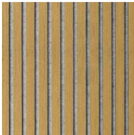
10040374281 Nature oiled Oak / Grau