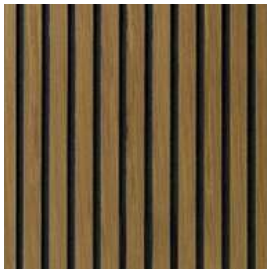
10040374286 Walnut / Sesam