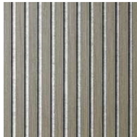
10040374283 Silver Oak / Grau