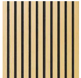
10040374284 White Oak / Sesam