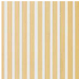
10040374278 White Oak / Beige