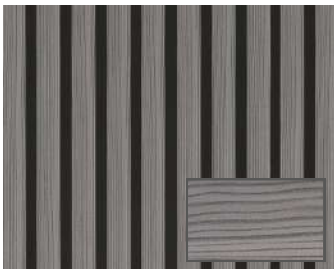
10040373879 Eiche grau - Holzdekor