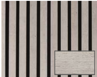
10040373877 Colorado Beton - Steindekor