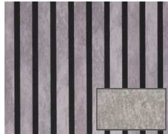
10040373878 Travertin grey - Steindekor