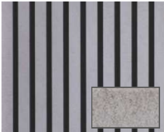
10040373881 Beton - Steindekor