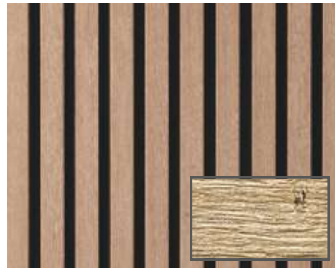
10040373889 Eiche Amalfi - Holzdekor