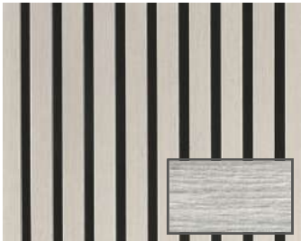
10040373887 Eiche weiß Verona - Holzdekor