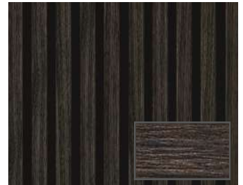
10040373888 Nussbaum Milano - Holzdekor