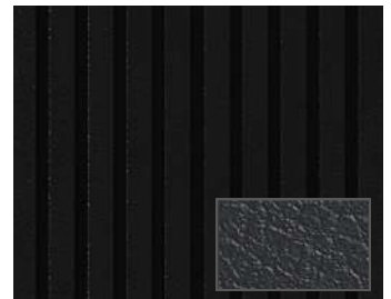
10040373885 Leder schwarz - Designdekor