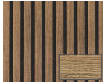
10040373886 Eiche Toscana - Holzdekor