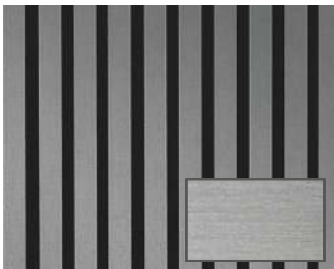
10040373882 Metall Edelstahl - Designdekor