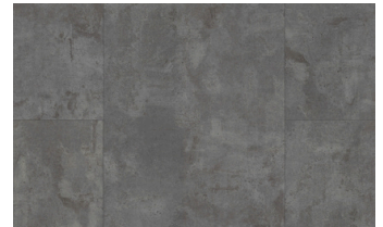
10040220714 San Pedro - Steinstruktur