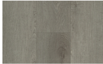
10040220708 Tela - Holzstruktur