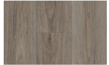
10040220710 San Vicente - Holzstruktur