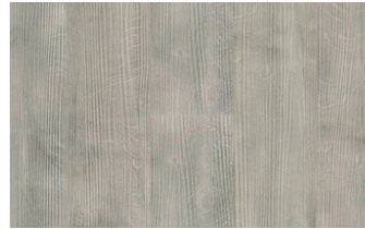
10040220709 Tilaran - Holzstruktur