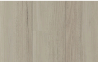
10040220707 Tamarindo - Holzstruktur