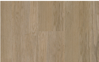
10040220711 Santa Ana - Holzstruktur