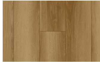
10040374852 Eiche Antique XL