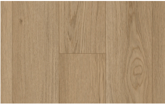
10040374847 Eiche Nature rustikal XL