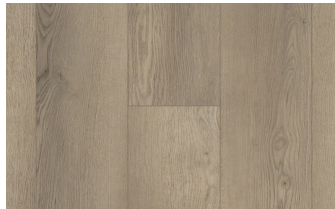
10040374845 Eiche Sierra grey XL