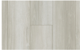
10040374848 Eiche Nordic XL