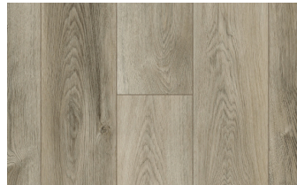
10040374854 Eiche Mocca XL