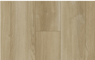
10040374849 Eiche Pearl XL