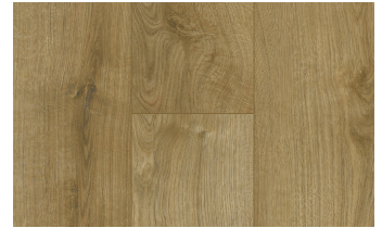
10040374856 Eiche Antique brown XL