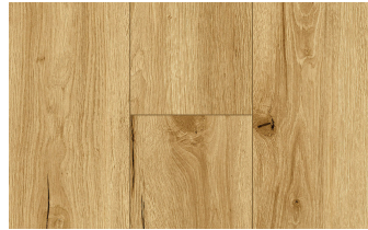
10040374855 Eiche Amber rustikal XL