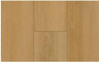
10040374850 Eiche Amber XL