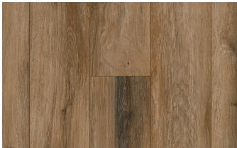
10040374853 Eiche Antique rustikal XL