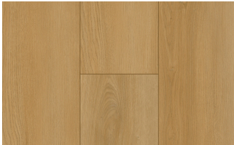
10040374860 Eiche Amber XXL