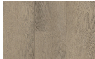
10040374857 Eiche Sierra grey XXL