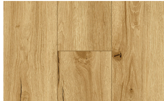
10040374862 Eiche Amber rustikal XXL