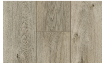
10040374861 Eiche Mocca XXL